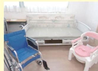
演習器材例 (ベッド、車いす、ポータブルトイレ)